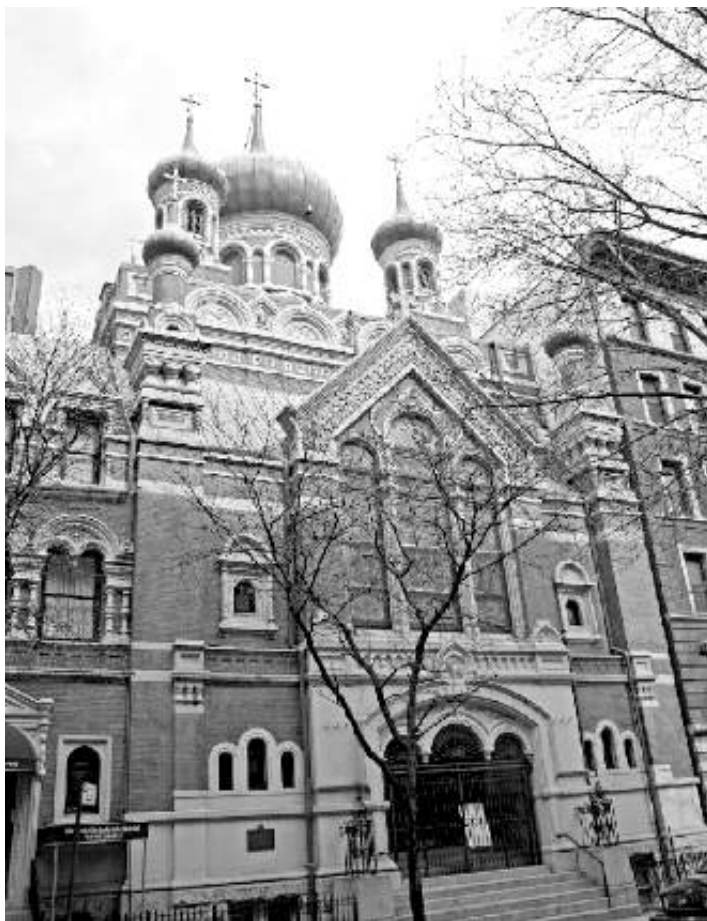
Свято-Николаевский кафедральный собор в Нью-Йорке