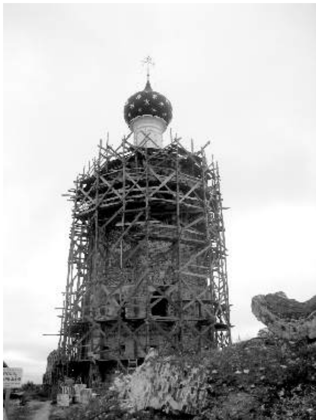
Успенская церковь-колокольня. На переднем плане руины Спасо-Преображенского собора

Что зовет, что держит людей в этих холодных и дождливых северных местах, что помогает им закрепить сердце и привязаться, что заставляет возвращаться снова и снова? Тишина ли, уединение, покой такой необыкновенный? Красота ли этих мест, строгая и выдержанная, но не холодная, а только тихая и радостная? Жители ли, приветливые и радушные? Леса, холмы, озера, города, монастыри? Может, сама земля, невыразимая, загадочная, светлая и намоленная?