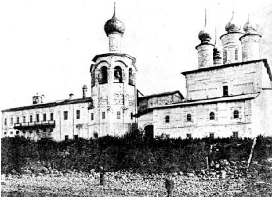
Спас-Каменный монастырь. Фото XIX века