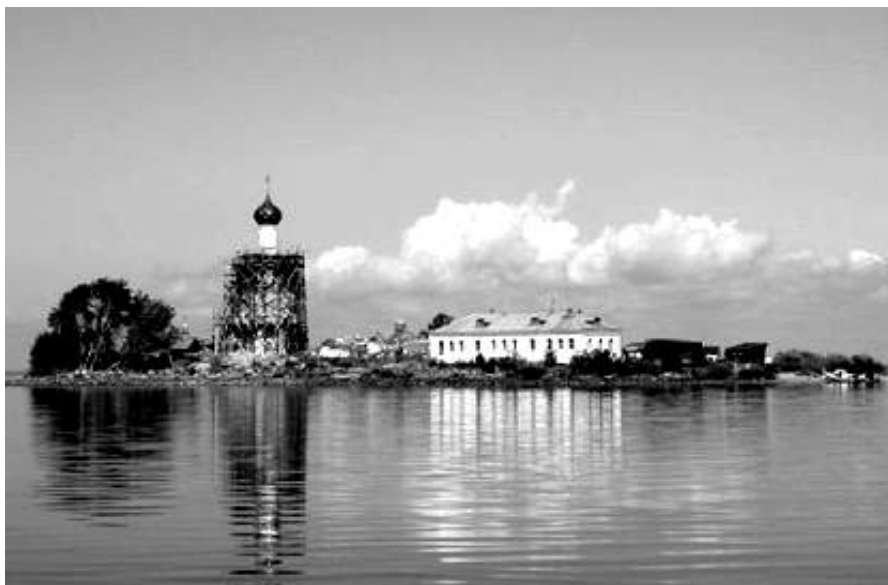
Вид на остров Спас-Каменный со стороны Кубенского озера